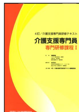
（テキストイメージ）

4訂／介護支援専門員研修テキスト 専門研修課程Ⅰ （発行：一般社団法人日本介護支援専門員協会 令和6年3月改訂）