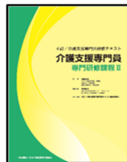
（テキストイメージ）